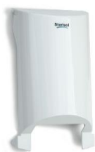
Art nr 4594