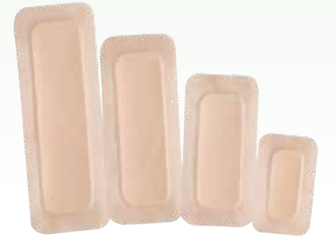
Rektangulära vidhäftande förband 8 x 13 cm, 10 x 20 cm, 10 x 25 cm, 10 x 30 cm