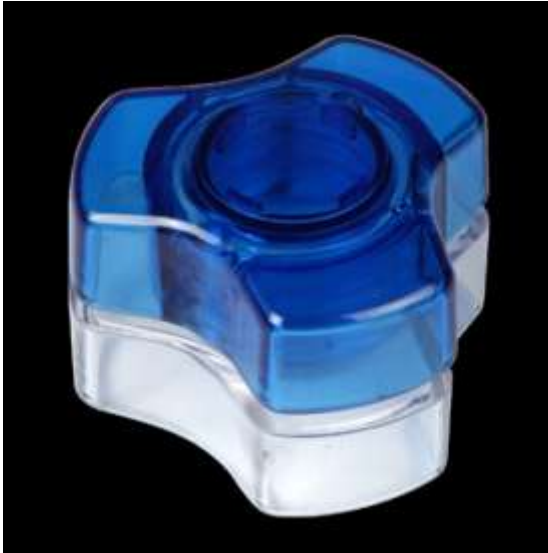
Medicinbägare, engångs, 30 ml finns transparent, gul, blå, röd