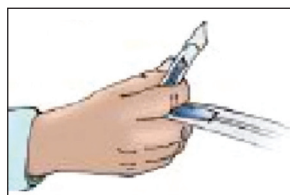
HomeCath® PLUS, enkel att använda.