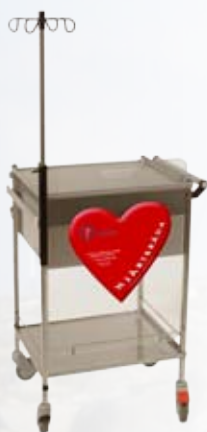
Bilden visar montering av hjärtbräda på HLR-vagn.