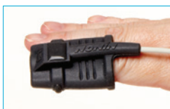
Soft Sensor Medium 8000SM