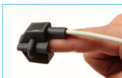
Soft Sensor Small 8000SS