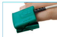
Pediatric Finger Clip 8000AP