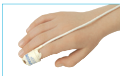
Engångssensorer Fler modeller