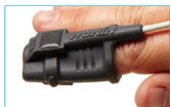
Soft Sensor Large 8000SL