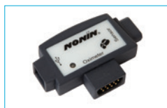
NONIN 1000 USB 1000USB