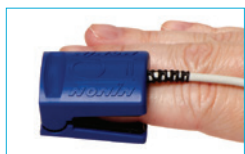
Adult Finger Clip 8000AA