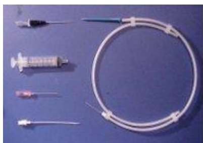
Tillbehör + en extra dilatator