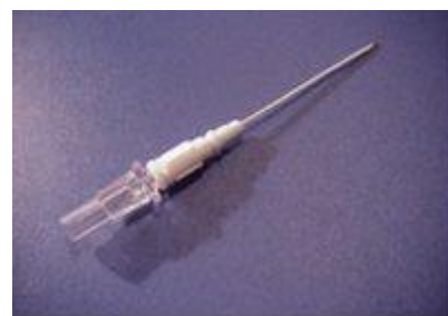
Kateter över kanyl