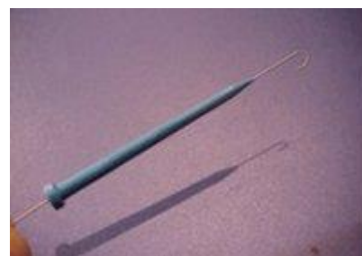
Ledare med uträtare