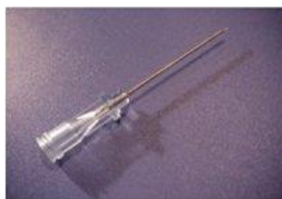
Kort Seldinger kanyl