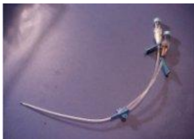
Kateter med klämmor och injektionsproppar