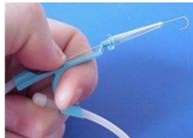
Ledare med enhands-mataren Arrow Advancer.