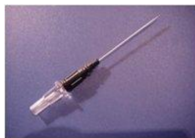
Kateter över kanyl