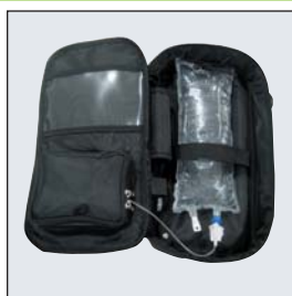
Bärväska 500ml/ 1000ml