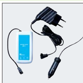
Ström adapter (inkluderad) Batteri pack (inkluderad) 12V adaptor(optional)