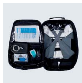
Ryggsäck 4L eller 2L för en eller två pumpar Svart, blå eller rosa Med eller utan hjul