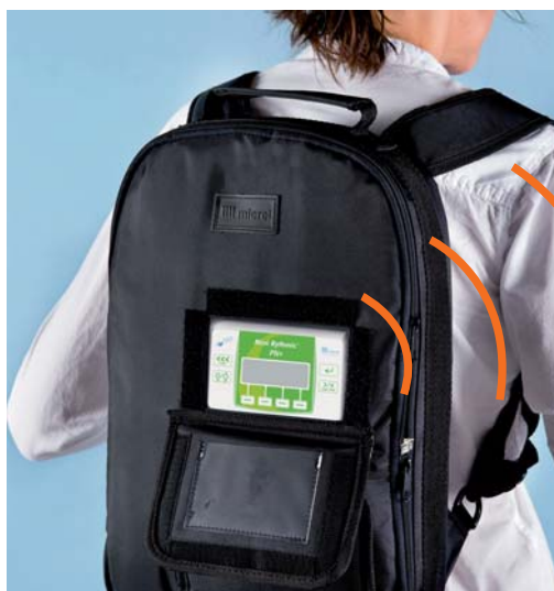
4L och 2L ryggsäck för 1 eller 2 pumpar