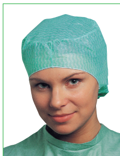
Operationsmössa, Peggy 621600, 621700 • Rymlig modell • Elastisk i nacken