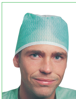
Operationsmössa, Philip 621301 • Knytband