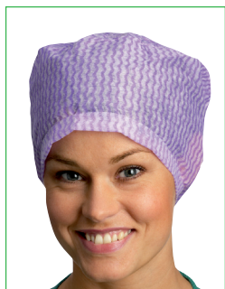
Operationsmössa, Kosack 621000, 621001 • Rymlig modell • Elastisk i nacken