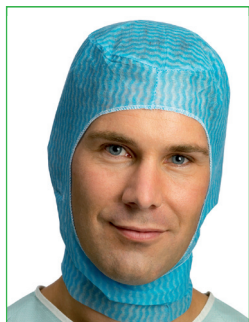
Operationsmössa, Tuck 620100 • Hjälmmodell med krage • Knytband