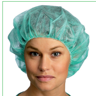
Operationsmössa, Annie 621500, 621715, 621725, 621735, 621825, 621835, 621925