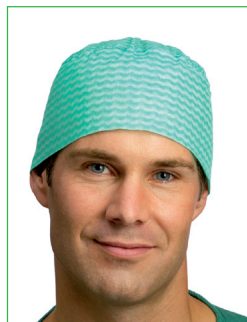
Operationsmössa, Jack 620300 • Tajt modell