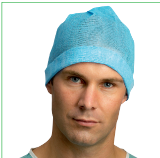
Operationsmössa, Eurocap 620800, 620810