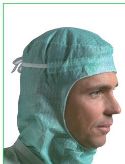
Operations hjälm, Albin 620500 • Hjälmmodell med krage • Svettband • Knytband