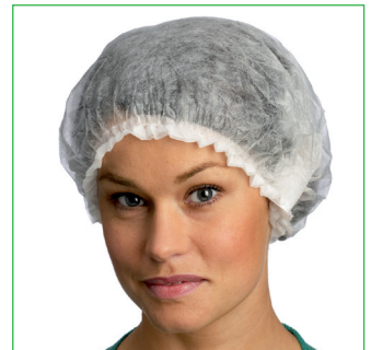
Operationsmössa, Charlotte 620900