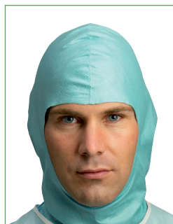
Operationsmössa 70000002 • Hjälmmodell med krage