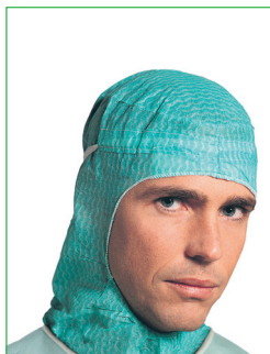
Operationsmössa, Glenn 620200 • Hjälmmodell med dok • Svettband • Knytband