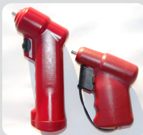
EZ-IO handtaget finns i två olika utföranden.

EZ-IO tillverkas av VIDACARE Corporation.