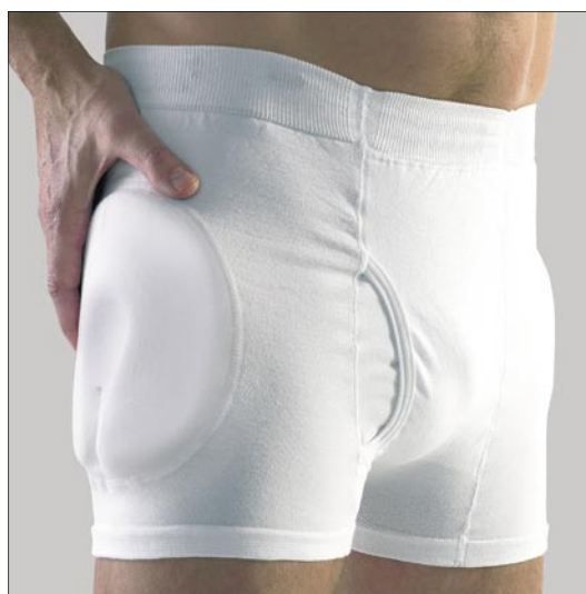
SafeHip® Classic Herr med mjuka skydd art. nr. 60301

Höftskyddsbyxa i unisexmodell med insydda mjuka skydd. Används som vanliga underbyxor alternativt som överdragsbyxa ovanpå andra underbyxor.