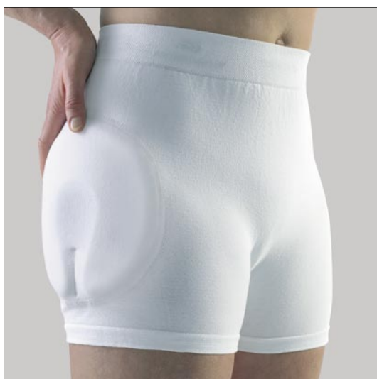
SafeHip® Classic Unisex med mjuka skydd art. nr. 60300

Höftskyddsbyxa i unisexmodell med insydda mjuka skydd. Används som vanliga underbyxor alternativt som överdragsbyxa ovanpå andra underbyxor.