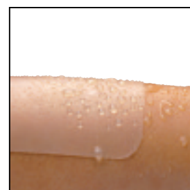
Hydrocoll kan behållas på vid dusch och bad.

Det gelformade skiktet förhindrar att Hydrocoll fastnar i såret. Förbandet kan tas bort smärtfritt utan att skada granulationen och den nybildade vävnaden.