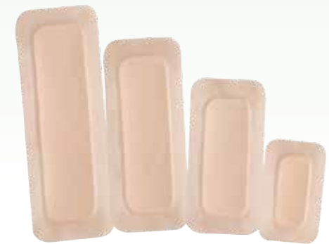
Rektangulära vidhäftande förband 8 x 13 cm, 10 x 20 cm, 10 x 25 cm, 10 x 30 cm