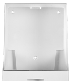
Art. nr. 4531 Dispenser 5 l av plast, vit med transparent kåpa. Mått: 250 x 210 x 185 mm.