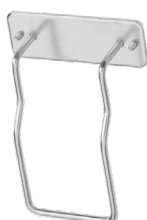
Art. nr. 4573 Sängfäste av metall. Passar alla Sterisol dispensrar 0,7 l.