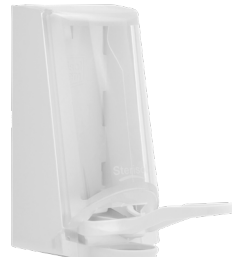
Art. nr. 4547 Dispenser 0,7 l av plast, vit med transparent kåpa. Underarmsdoser- are av plast. Mått: 200 x 110 x 200 mm.