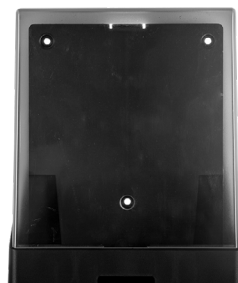
Art. nr. 4535 Dispenser 5 l av plast, svart med tonad trans- parent kåpa. Mått: 250 x 210 x 185 mm.