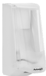
Art. nr. 4546 Automatdispenser 0,7 l, vit med transparent kåpa. EMC-godkänd. Batteridrivnen. Batterier medföljer ej. Mått: 228 x 117 x 130 mm.

Art nr. 4551, 4552: POM / PAGF / PC / ABS Art nr. 3551, 3552: PAG / PC / ABS