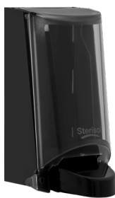
Art. nr. 4552 Dispenser 0,7 l av plast, svart med tonad trans- parent kåpa. Mått: 200 x 115 x 120 mm.