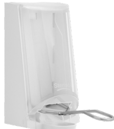
Art. nr. 4567 Dispenser 0,7 l av plast, vit med transparent kåpa. Underarmsdoser- are av metall. Mått: 200 x 110 x 200 mm.