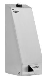
Art. nr. 4569 Dispenser 0,7 l, robust och låsbar av rostfritt stål. Mått: 260 x 102 x 140 mm.