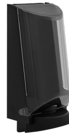
Art. nr. 3552 Dispenser 2,5 l av plast, svart med tonad trans- parent kåpa. Mått: 340 x 180 x 130 mm.