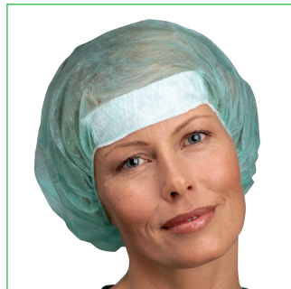
Operationsmössa, Annie 621845