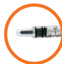
LD = low dose