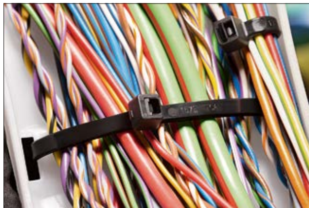
Standard Buntband i T-serien- för alla typer av applikationer.