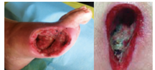
(Exempel på djupare sår)