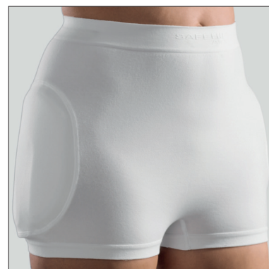
60310: Safehip® AIRX Unisex

Höftmättet skall tas över stussen på bredaste stället, centimetermätt.