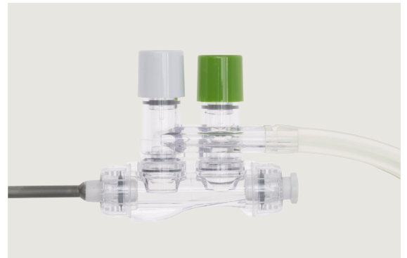
Sug- och spolset - vinkelstycke.