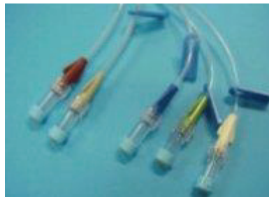
Avstängningsklämmor och injektionsproppar