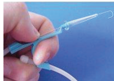
Ledare med enhands-mataren Arrow Advancer.