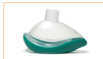
ClearLite anestesi mask, storlek 4