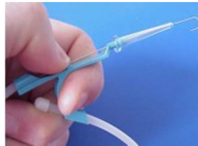
Ledare med enhands- mataren Arrow Advancer.