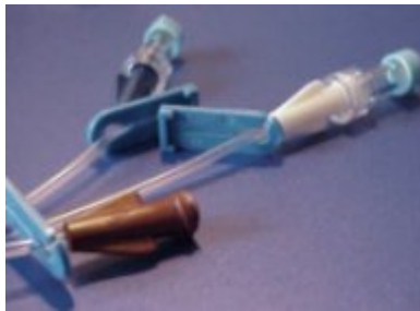
Avstängningsklämmor och 2 st injektionsproppar