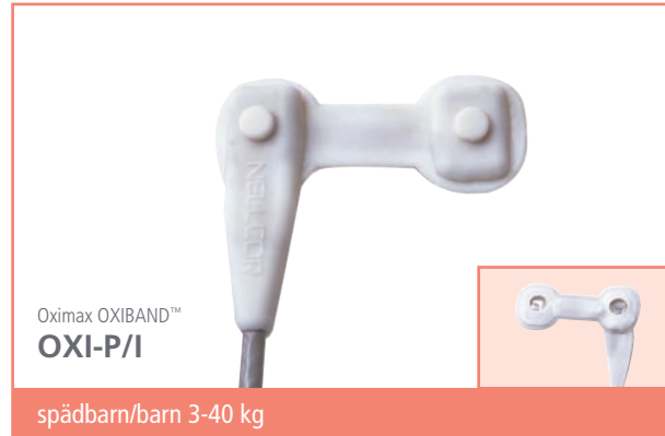
Oximax OXI-BAND™ OXI-P/I