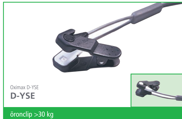
Oximax D-YSE D-YSE