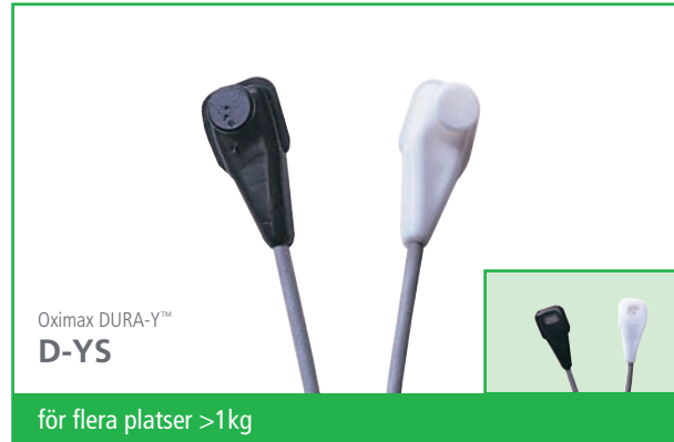
Oximax DURA-Y™ D-YS