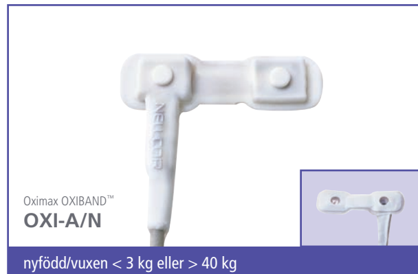
Oximax OXI-BAND™ OXI-A/N