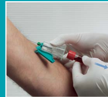
5 Ta bort det sista röret