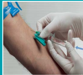
4 Sätt i röret