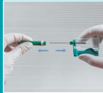
2 Ta bort skyddshylsan

* Detta steg gäller inte för QUICKSHIELD Komplet och Komplet PLUS.