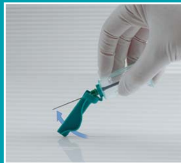
6 Aktivera säkerhetsmekanismen