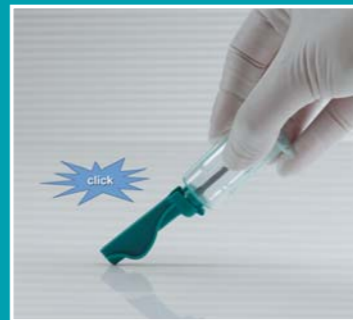
7 Ett hörbart klick bekräftar aktivering