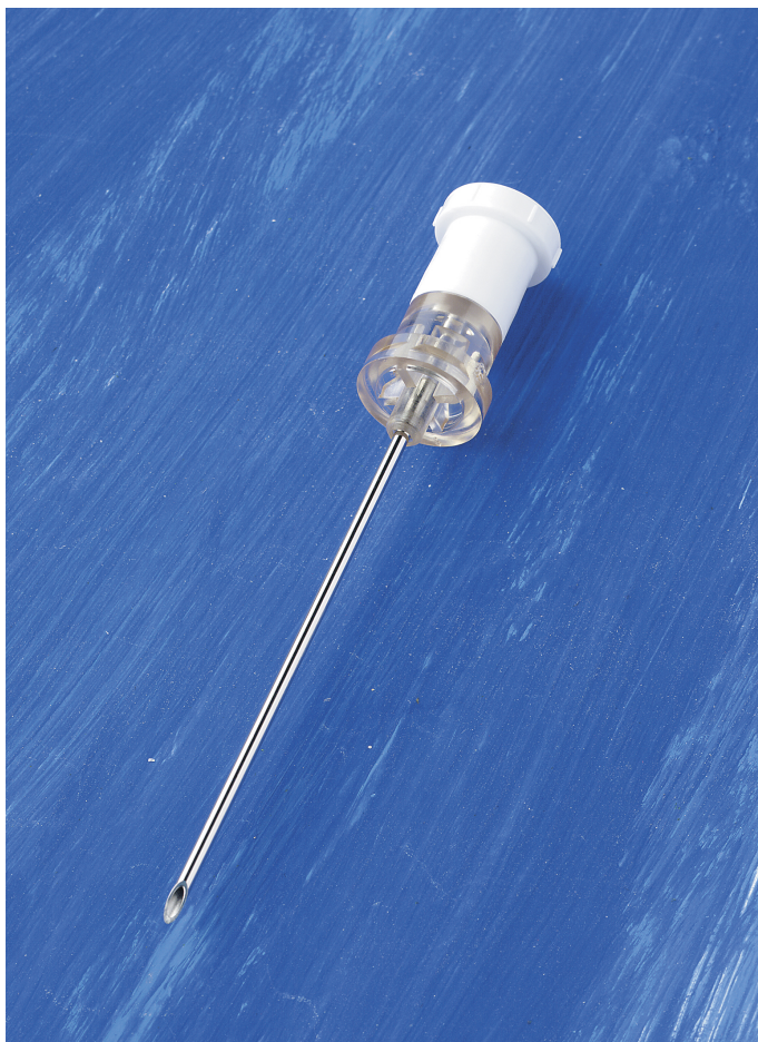
Luftningskanyl med inbyggd övertrycksventil

Filter-Straw - en uppdragningskanyl i plast med integrerat 5µm filter. Flexibel tunn slang för enkel och effektiv uppdragnings från läkemedelsampuller.