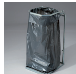
Säckar av återvunnen polyeten