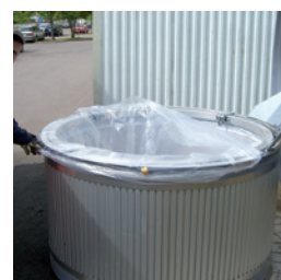
Insatssäck för djupbehållare