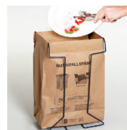
Matavfallsbärkasse 22 lit