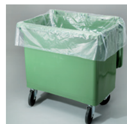
Insatssäck för käril