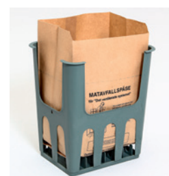
Matavfallspåse 9 lit