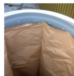
Insatssäck djupbehållare 800 lit