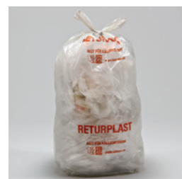
Källsorteringssäckar med knythandtag