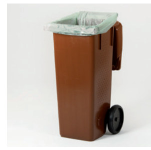
Insatssäck för kärl