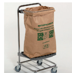
Matavfallssäck 45 lit