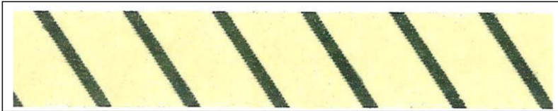
Färg efter steriliseringsprocessen