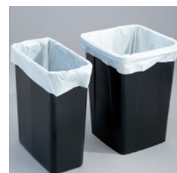
Insatssäck för sorteringsbehållare