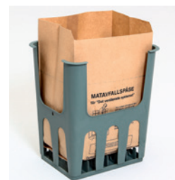
Matavfallspåse 9 lit