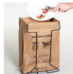
Matavfallsbärkasse 22 lit