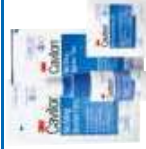
3M™ Cavilon™ No Sting barriärfilm