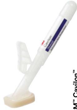
3M™ Cavilon™ Advanced hudskyddsmedel