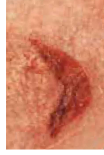
Häftämnesrelaterade hudskador (MARS)