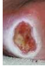
Skadad hud runt sårkanten