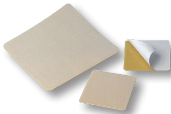
DuoDERM® Standard bandasje