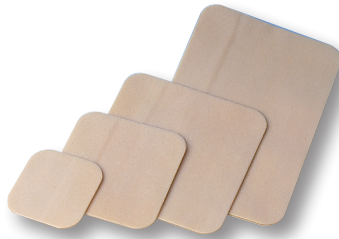
DuoDERM® E bandasje