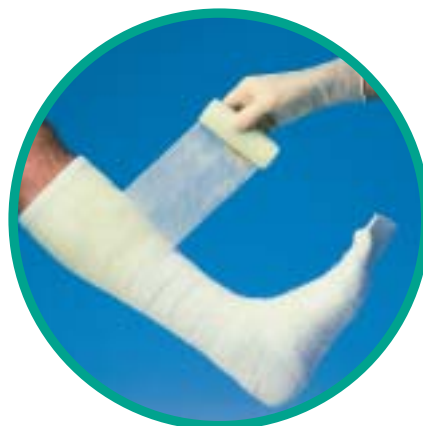
Snabbt och enkelt att applicera