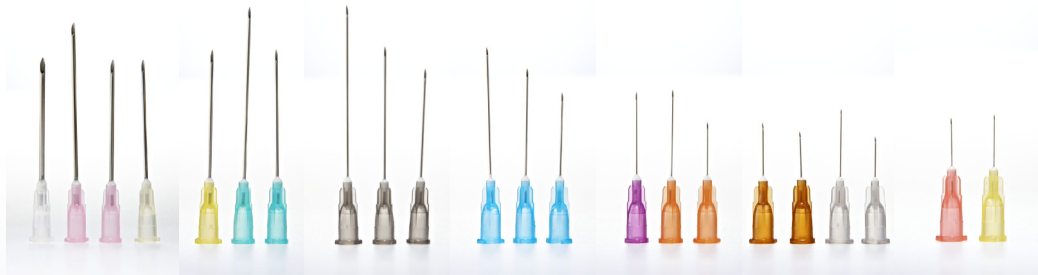
16–19G 20–21G 22G 23G 24–25G 26–27G 29–30G

Steril silikonbelagd kanyl i rostfritt stål för engångsbruk. De blisterförpackade KD-FINE injektionskanylerna är färgkodade och etylenoxid steriliserade. De största kanylerna (16–19G) passar bäst till uppdragning, mellanstora (20–23G) kanyler till muskel och veninjektioner. De minsta kanylerna (24–30G) passar bäst till subcutana injektioner. Kanylerna är latexfria.