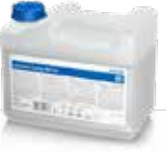
Aniosyme Synergy WD Plus 5 litran kanisteri

Monoentsyymaattinen emäksinen pesuaine tehokkaaseen puhdistukseen