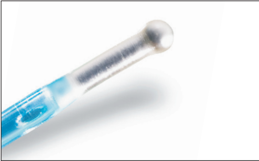
Specialdesignet blød kuglespids