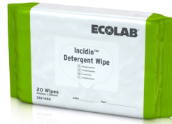
INCIDIN™ DETERGENT WIPE EKSTRA STOR (430 x 300 MM) 12 x 20 WIPES FLOWPACK