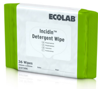
INCIDIN™ DETERGENT WIPE STANDARD (300 x 200 MM) 12 x 36 WIPES FLOWPACK