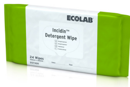
INCIDIN™ DETERGENT WIPE STOR (300 x 300 MM) 12 x 24 WIPES FLOWPACK