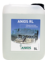
Anios RL 5 L dunk