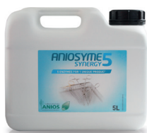
Aniosyme Synergy 5 5 L dunk

UNIKT 5-enzymatisk detergent til manuel og automatisk genbehandling