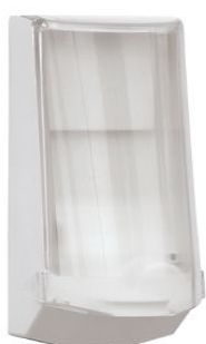
Vare nr. 4546 Automatisk dispenser