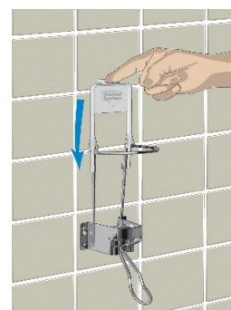
Vare nr. 9500 Dispenser Vare nr. 9500 Bøjle til dispenser