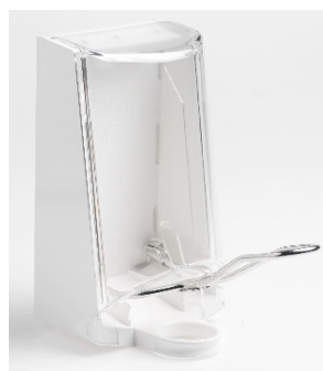
Vare nr. 4567