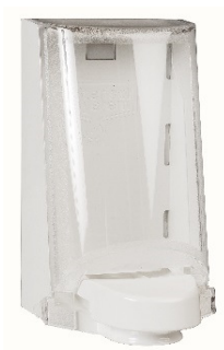
Vare nr. 4551