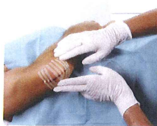
Omnistrip fikseres efter et mindre kirurgisk indgreb.

At Omnistrip er gennemtrængelig for luft og fugt begrænser risikoen for, at der skal opstå maceration af huden. Tapen fæstner sikkert, men kan dog fjernes smertefrit og efterlader ingen klæberester på huden. Omnistrip absorberer ikke røntgenstråler og behøver derfor ikke at fjernes inden røntgenundersøgelser. Omnistrip lader kun 7% af solens UV-stråling slippe igennem.