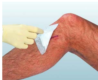
Cutiplast är till för täckning av vätskande sår

Sårförbanden är radiotransparenta. Cutiplast är lätt att klippa till från rulle medan Cutiplast Steril är styckeförpackat och sterilt.