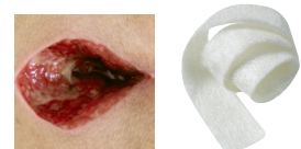
Biatain Alginate, filler

Biatain® Alginate har en optimal absorption sammenlignet med Aquacel® 1