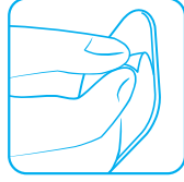
1. FJERN DÆKFILMEN