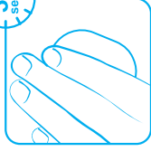
3. HOLD FORSIGTIGT PÅ BANDAGEN I CA. 30 SEK