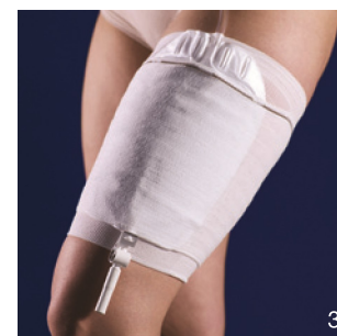
CareBag er på plads.