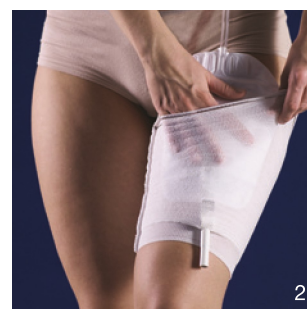
Placer urinposen i lommen og træk urinposens ventil gennem hullet forneden.