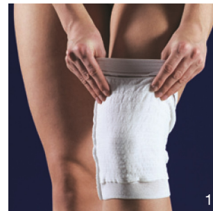
Træk fikseringen på benet (med farvemærkning øverst).